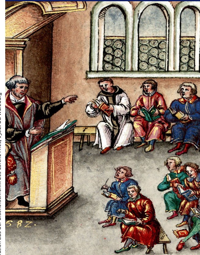
Illustration aus der Bischofschronik des Lorenz Fries, 1582. UB Würzburg

Julius-Maximilians- UNIVERSITÄT WÜRZBURG