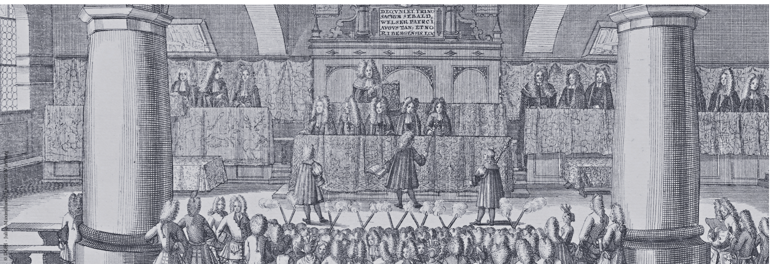
Das Auditorium Welferianum im Collegio zu Altdorf mit einem Actu Doctorali, dergleichen sehrlich am Petri und Pauli Festdarinnen vorgenommen wird.

Julius-Maximilians- UNIVERSITÄT WÜRZBURG